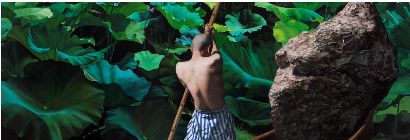
Ausschnitt aus „Ferry with stone in lotus pond“ (Na Wei, 2012, Öl auf Leinwand)

Für die Anmeldung zum Symposium wenden Sie sich bitte per Email an: veranstaltung@konfuzius-institut-bremen.de